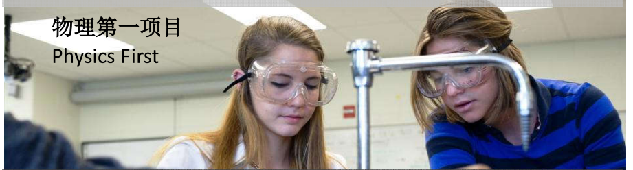
物理第一项目 Physics First