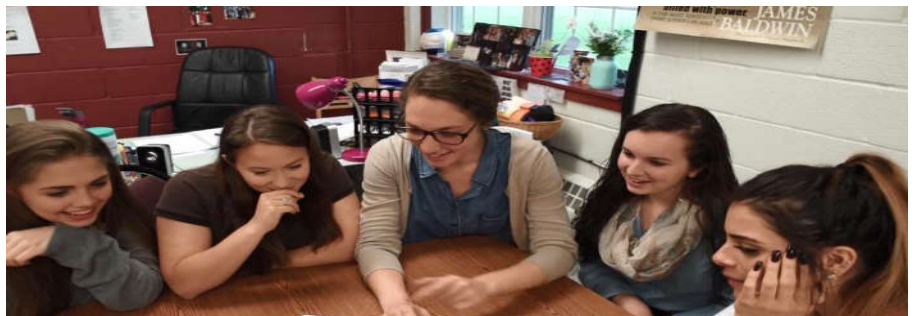
个性化辅导: 本校的切萨皮克学习中心为有学习差异的学生们提供支持, 进行个体辅导、规划和咨询。所设的 ESL 课程包括有两年的英语沟通课。